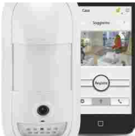
Soluzione integrata per la sicurezza