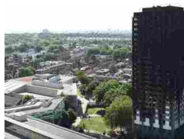
Grenfell Tower: analisi dal punto di vista del progettista antincendio